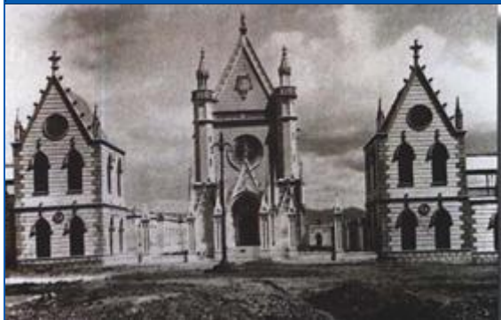
El Hospital Goyeneche 1912

"La arcada que defiende la fachada (Fotografía N°4), es toda de terracota modelada artísticamente. En el interior, y por todo adorno se descubren 14 altos relieves que representan las Estaciones de la Vía Crucis. El altar, también modelado en terracota es sencillísimo y guarda la Custodia, que según al decir de los entendidos, es maravillosamente artística.