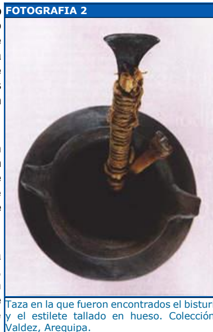
Taza en la que fueron encontrados el bisturí y el estilete tallado en hueso. Colección Valdez, Arequipa.