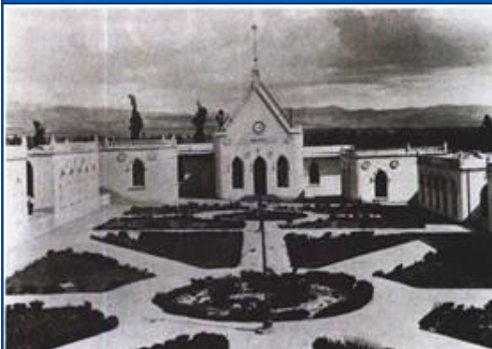
El Hospital Goyeneche 1912